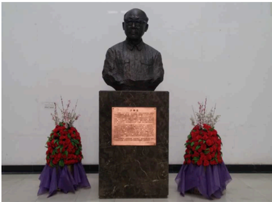
吉林大学数学学院王湘浩院士雕塑

1952年全国高等院校大调整，党中央和中央人民政府决定将东北人民大学建设成为一所文理兼备的综合性大学。为此，高等教育部 4 从北京大学、清华大学、燕京大学等院校抽调了一部分教师进行支援，王湘浩、余瑞璜、唐敖庆等就是在这时来到东北人大的。经过此次调整，东北人大新建了数学、物理、化学三个理科系，首次开设了数学专业。