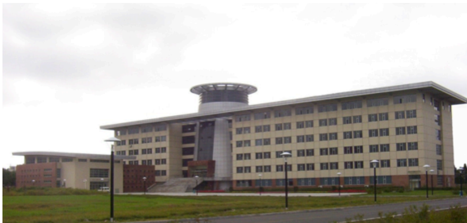
吉林大学数学学院

与此同时，东北人民大学 2 与南京大学也先后创办了计算数学专业，与北京大学一同成为我国最早创办计算数学专业的高校。本文所要讲述的，就是当年东北人民大学创办计算数学专业的人和事儿。