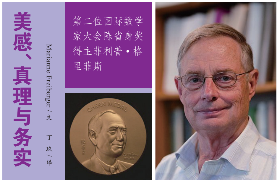
格里菲斯获得 2014 年 ICM 大会陈省身奖

“我喜欢菲利普·格里菲斯 (Phillip Griffiths) 的书，每当我读到一本他的书，我都想拥抱这个人。”这是我在首尔国际数学家大会喝咖啡时碰到的一位数学家，赋予格里菲斯数学教科书的罕见赞美。因为格里菲斯刚被授予陈省身奖，他加入了我们的聊天。该奖“对格里菲斯在数学领域的杰出成就给予最高级别的表彰，”这些成就包括他的数学工作，但也包括他的书，以及他对数学教育和数学界的整体贡献。