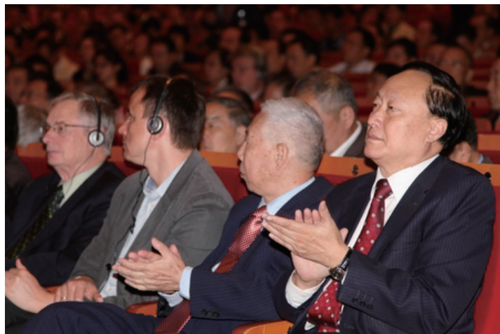
格里菲斯 (左) 2013 年 10 月参加北京大学数学学科百年庆典

听格里菲斯谈数学，你得到的一个明显感觉是什么会吸引他。他引用数学家赫尔曼·外尔 (Herman Weyl) 的话：“我的工作总是试图将真理与美连在一起，但是当我不得不