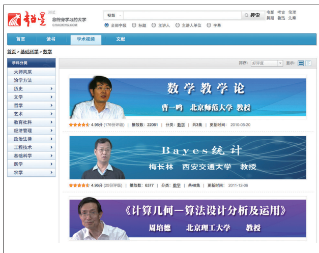
图5 超星学术视频教学课程