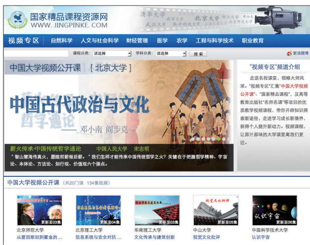
图3 国家精品课程网站