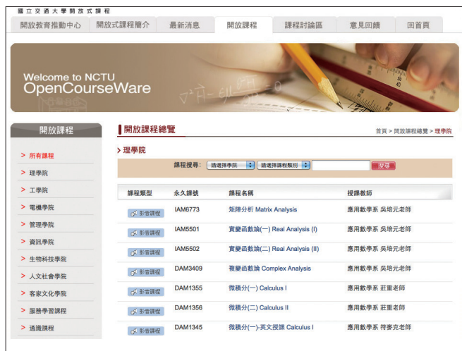
图4 台湾国立交通大学数学开放课程