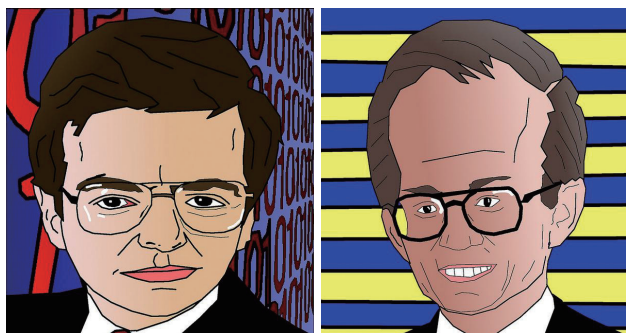
舒尔茨 Myron Scholes

细心的读者可能已经注意到：股票的期望收益率 \mu ，明明是作为所谓“漂移项”出现在股价的随机微分方程里的，可在 BS 公式里它却悄然消失了。直觉上人们容易认为期权的价格应该等于它在到期日可能得到的各种回报的折现值的