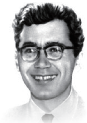
吉尔萨诺夫 Igor Vladimirovich Girsanov

换到底是怎么一回事了。假设市场中另有一只股票，其价格 \tilde{S}_t 满足如下随机微分方程：