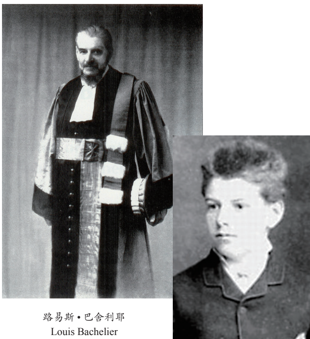
路易斯·巴舍利耶 Louis Bachelier

普朗克-柯尔莫哥洛夫 (Fokker-Planck-Kolmogorov) 方程。布朗运动的引入，大大方便了巴舍利耶进一步研究股票期权的定价问题。股票期权是一种衍生证券合约，合约确定了一个执行价格 K 。以看涨期权为例，等时间来到期权的到期日 T 时，假如股票的价格 S 高于 K ，期权的持有人将获得 S-K 的收益，假如股票的价格 S 低于或等于 K ，则收益为零。假如你是个投资者，判断牛市来临，你可以买看涨期权，如果最终股价真的上涨了，则你和买股的人一样有钱赚，如果下跌，则你不必继续跟着买股的人输钱，而你的投资成本，即期权的价格，相对于直接购买股票要低，此可谓四两拨千斤。