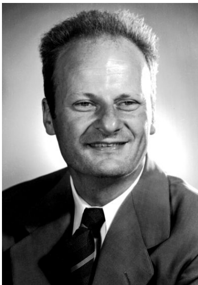
贝特(Hans Bethe, 1906-2005), 因在1938年解释了为什么恒星能够长时间向外释放如此之多的能量而获得1967年诺贝尔物理学奖。贝特对冯·诺伊曼极为佩服。

很好的传统，那就是午餐时分的家庭聚会。孩子们争相提出一个个问题供大伙讨论，比如海涅的某一首诗、反犹太主义的危害性、“泰坦尼克”号的沉没、外祖父的成就，等等。