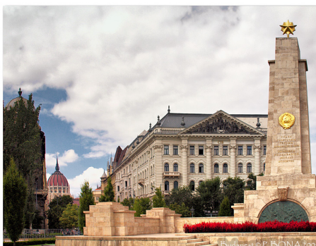
布达佩斯自由广场