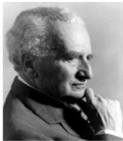
Theodore von Kármán