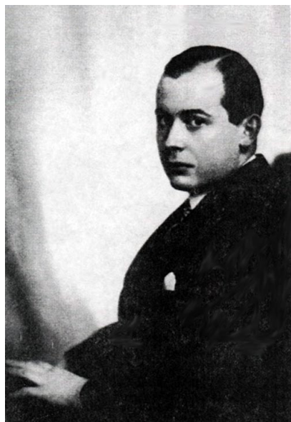
冯·诺伊曼的少年时代