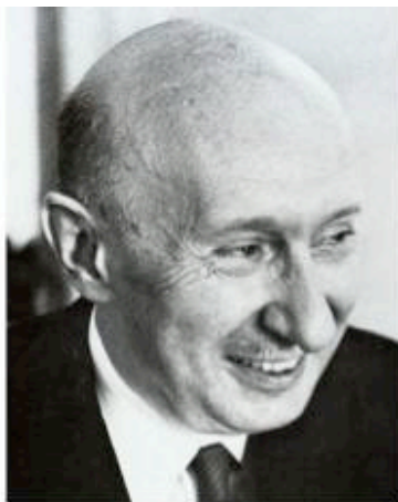
Georg von Békésy