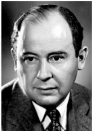
John von Neumann