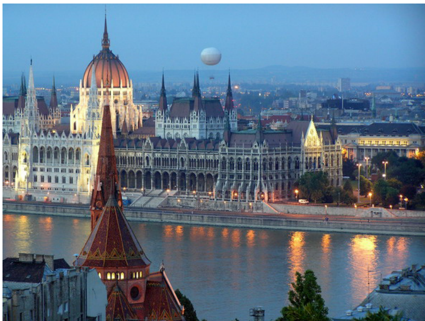
匈牙利首都布达佩斯：冯·诺伊曼度过青少年的地方

人会惨遭种族灭绝，如同一次大战期间土耳其的亚美尼亚人所遭受的屠杀一样之后，乘着两个劲敌（德国和苏联）鹬蚌相争，美国会坐收渔利。他还认定，苏联人迟早会发明核武器，因为“原子弹的秘密很简单，受过教育的人都会研制”。至于平衡能力，对他来说可能是与生俱来的，而非雄心所致，他不需要花钱去改善公共关系。他还有一个显著的特点，不事张扬也不喜欢与人辩论，遇到紧张的气氛时善于利用讲段子和逸闻将其化解。